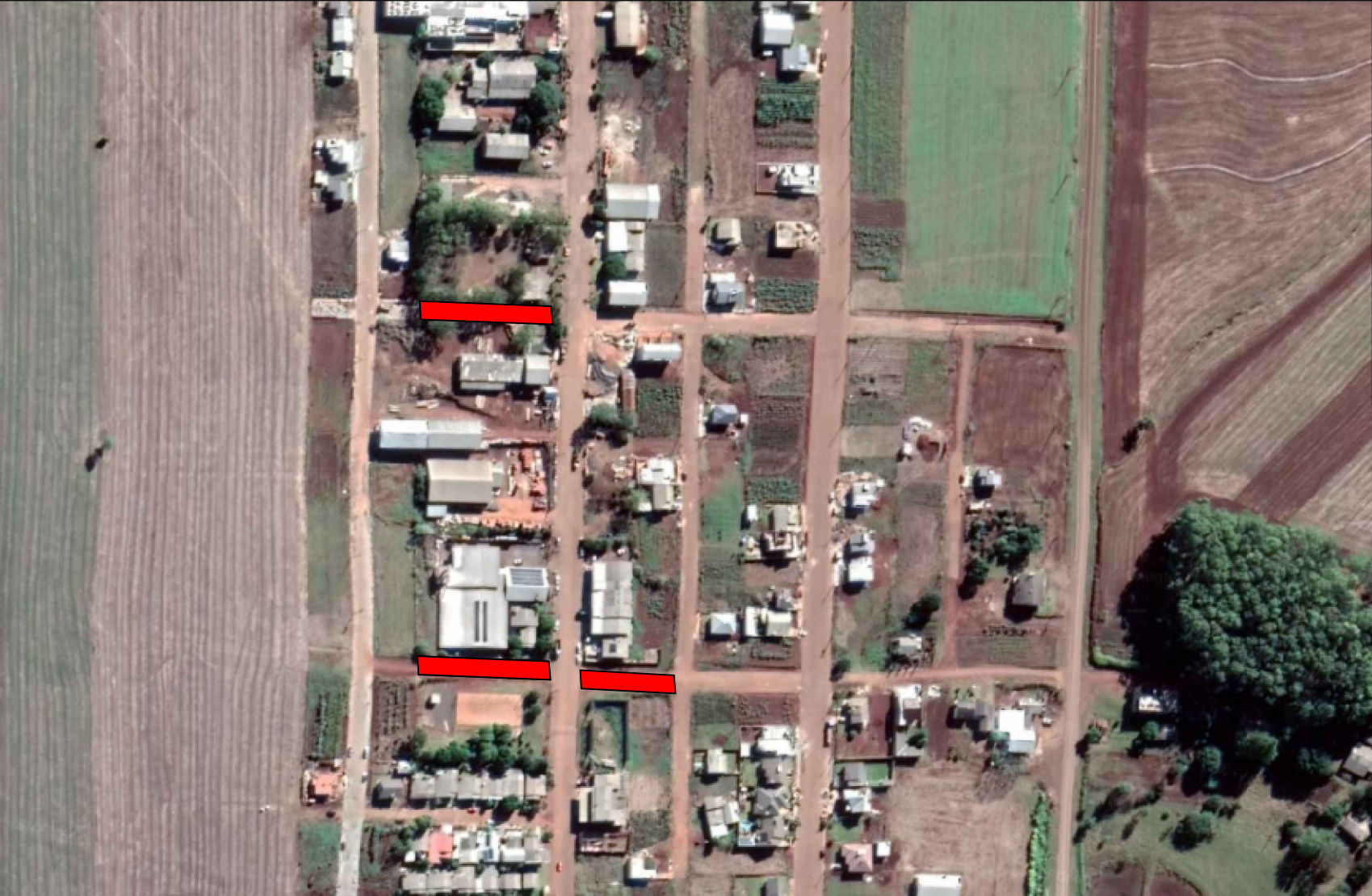
LOCALIZAÇÃO RUAS PARA PAVIMENTAR COM PEDRAS IRREGULARES